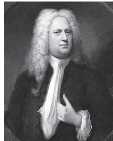
Georg Friedrich Händel

Koning der koningen en Heere der heren. Halleluja!